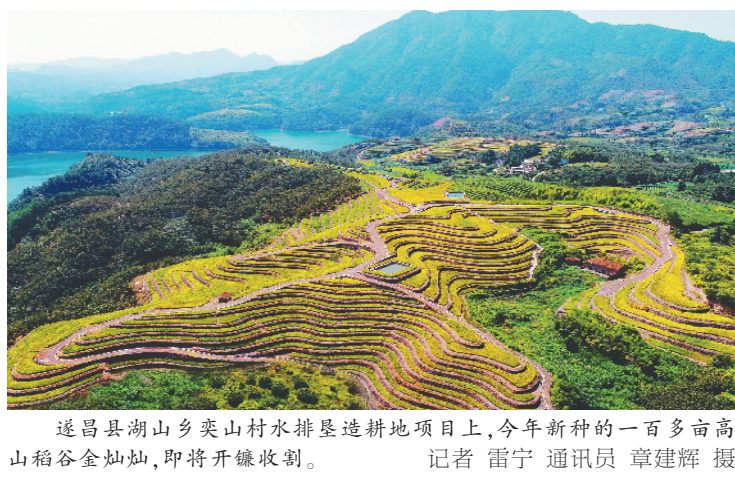
遂昌县湖山乡奕山村水排星造耕地项目上,今年新种的一百多亩高山稻谷金灿灿,即将开镰收割。

感受到了清新的空气。”说起“垃圾山”,时常来往温溪与小舟山的邹先生颇有感触。还有群众说,将垃圾移除一直是大家心底最期盼的事,没想到今天终于实现了,大家感到十分开心。