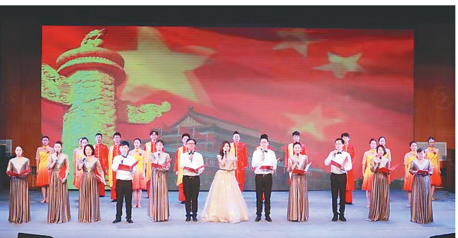
昨日,市文广旅体局系统举办的迎国庆主题朗诵会在市文化馆拉开大幕。本次朗诵会,既是向中华人民共和国成立70周年的一份献礼,也是市文广旅体局系统开展的一次革命传统教育活动,抒发了丽水文旅人爱党、爱国、爱人民、爱家乡的真情实感。

上了一条积极调整产品结构、差异化发展的智能制造新路子,形成了自主研发、零配件供应、整机装配等完整的生产体系,并开始向智能制造行业拓展,逐步发展成为现今全国乃至世界先进水平的智能制造生产基地。浙江畅尔智能装备股份公司、浙江金马逊机械有限公司连续拿下2个省科学技术进步奖一等奖,实现历史性突破。