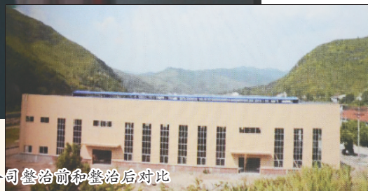
青田凯勃阀门有限公司整治前和整治后对比

“过去这一片是浓烟滚滚和污水横流的阀门企业,现在这里是一片绿水青山。以前早上擦的桌子,晚上已是一层厚厚的灰尘,用清水一擦,留下黑黑的印痕。现在粉尘少了,噪音没了,污水也不见了,工业园区面貌焕然一新!”