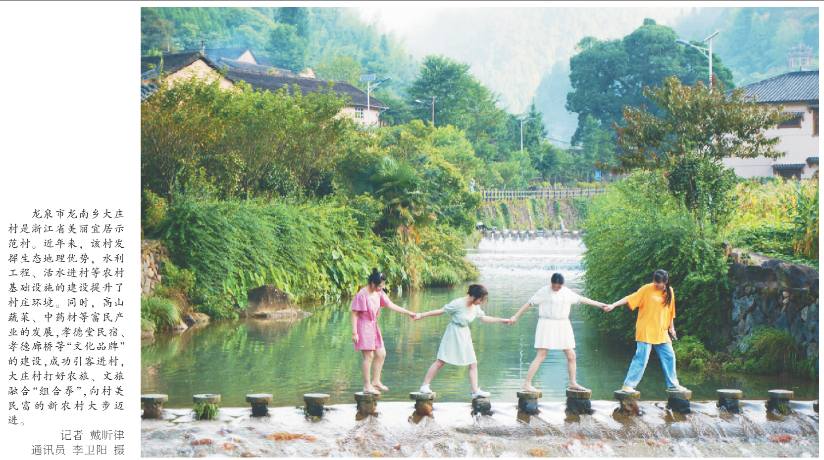
龙泉市龙南乡大庄村是浙江省美丽宜居示范村。近年来,该村发挥生态地理优势,水利工程、活水进村等农村基础设施的建设提升了村庄环境。同时,高山蔬菜、中药材等富民产业的发展,孝德堂民宿、孝德廊桥等“文化品牌”的建设,成功引客进村,大庄村打好农旅、文旅融合“组合拳”,向村民富的新农村大步迈进。

垃圾“三大革命”等民生大事和“关键小事”上,让发展更有“温度”,让幸福更有“质感”。 胡海峰强调,要形成合力,充分发挥市委财经委、市委财办和各经济部门职能作用,扎实做好全市经济领域重大工作的顶层设计、总体布局、整体推进等各项工作;要提升能力,潜心学习钻研经济、财政、金融等知识,强化对宏观经济等领域前沿问题思考,全面提升驾驭经济工作的能力和水平;要提高效力,建立“科学公平、权责清晰、财力协调、区域均衡”的市县(市、区)财政关系,把全市域的资源、资产、资本、资金、资信统筹起来,集中财力办大事,努力开创全市财经工作新局面。