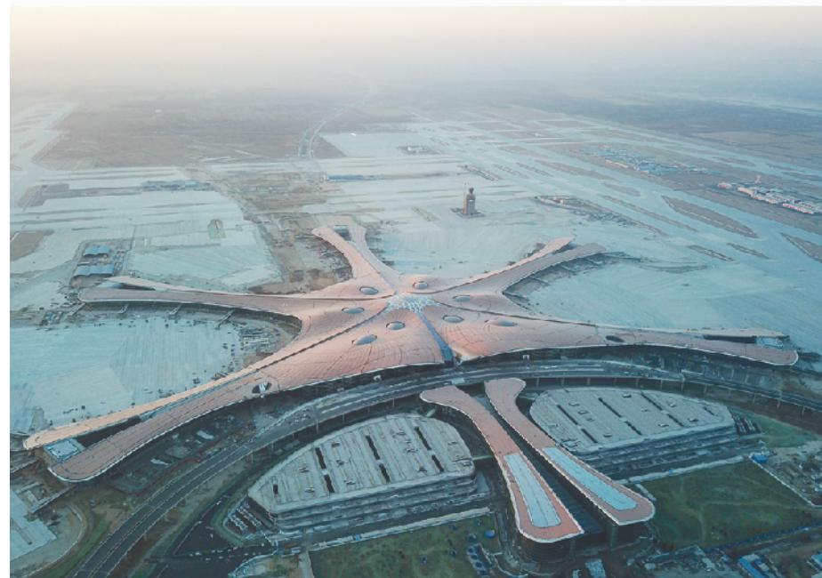
上图为2017年2月25日拍摄的北京新机场建设工地;下图为2018年12月29日拍摄的主航站楼外立面装修工程全面完成的北京大兴国际机场。

易试验区、探索建设中国特色自由贸易港;从再次举办“一带一路”国际合作高峰论坛,到谋划推动长江三角洲区域一体化、中部地区崛起等重大区域战略…… 过去一年来,党中央统筹国际国内,科学决策,大开大合,一系列着眼全局的大战略、大手笔,坚定着中国发展的信心,也稳定着外界对中国的预期。