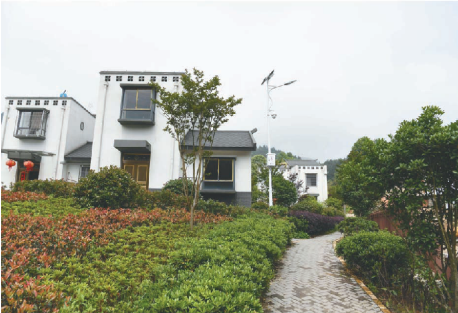
上图为安徽省金寨县花石乡大湾村村民的住房(2016年4月25日摄);下图为大湾村易地扶贫安置点的村民住房(2019年5月18日摄)。