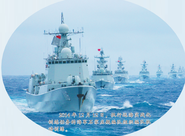
2014年12月12日,执行远海训练任务的海军石家庄舰编队组织编队机动训练。

这是穿越百年的夙愿,这是走向深蓝的远航。 从长江之畔的村庄起步,一路穿越溪流江河,一路涉过激流险滩,奔向大海,拥抱大洋。 航空母舰接续下水,新型战舰批量入列,转型建设硕果累累,海上维权实现历史性突破……在中国海防建设史上,海军的阵容从来没有像现在这样威武雄壮。 70年奋斗历程波澜壮阔,新时代崭新征程气壮山河。 寄托着中华民族向海图强世代夙愿,70年来,在中国共产党的坚强领导下,人民海军在战火中诞生,在发展中壮大,从无到有、从小到大、从弱到强,一路劈波斩浪,纵横万里海疆,勇闯远海大洋,逐步发展成为五大兵种齐全、核常兼备的战略性军种。 进入新时代,人民海军坚定不移加快现代化进程,大踏步赶上时代发展潮流,加速向全面建成世界一流海军迈进,取得了举世瞩目的伟大成就,正以全新姿态屹立于世界东方。