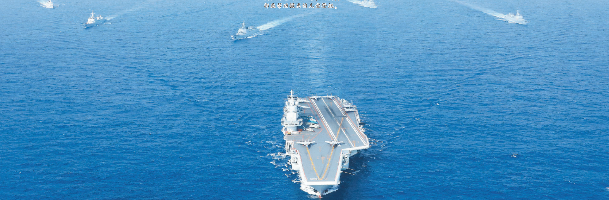
2018年4月18日,执行远海训练任务的辽宁舰编队在西太平洋海域组织编队运动训练。