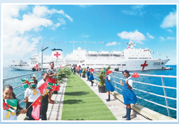
2018年10月12日,在多米尼克首都罗索,当地学生挥动多中两国国旗欢迎中国海军和平方舟医院船首次到访。