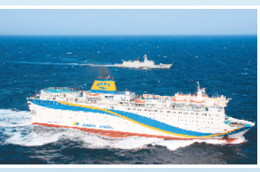
2011年3月1日,徐州舰为撤离我在利比亚同胞的船舶护航。