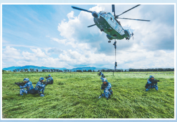
2017年6月26日,“蛟龙突击队”队员在某训练场组织进行直升机滑降训练。