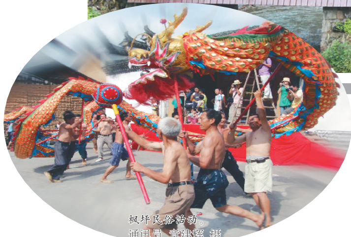
枫坪民俗活动