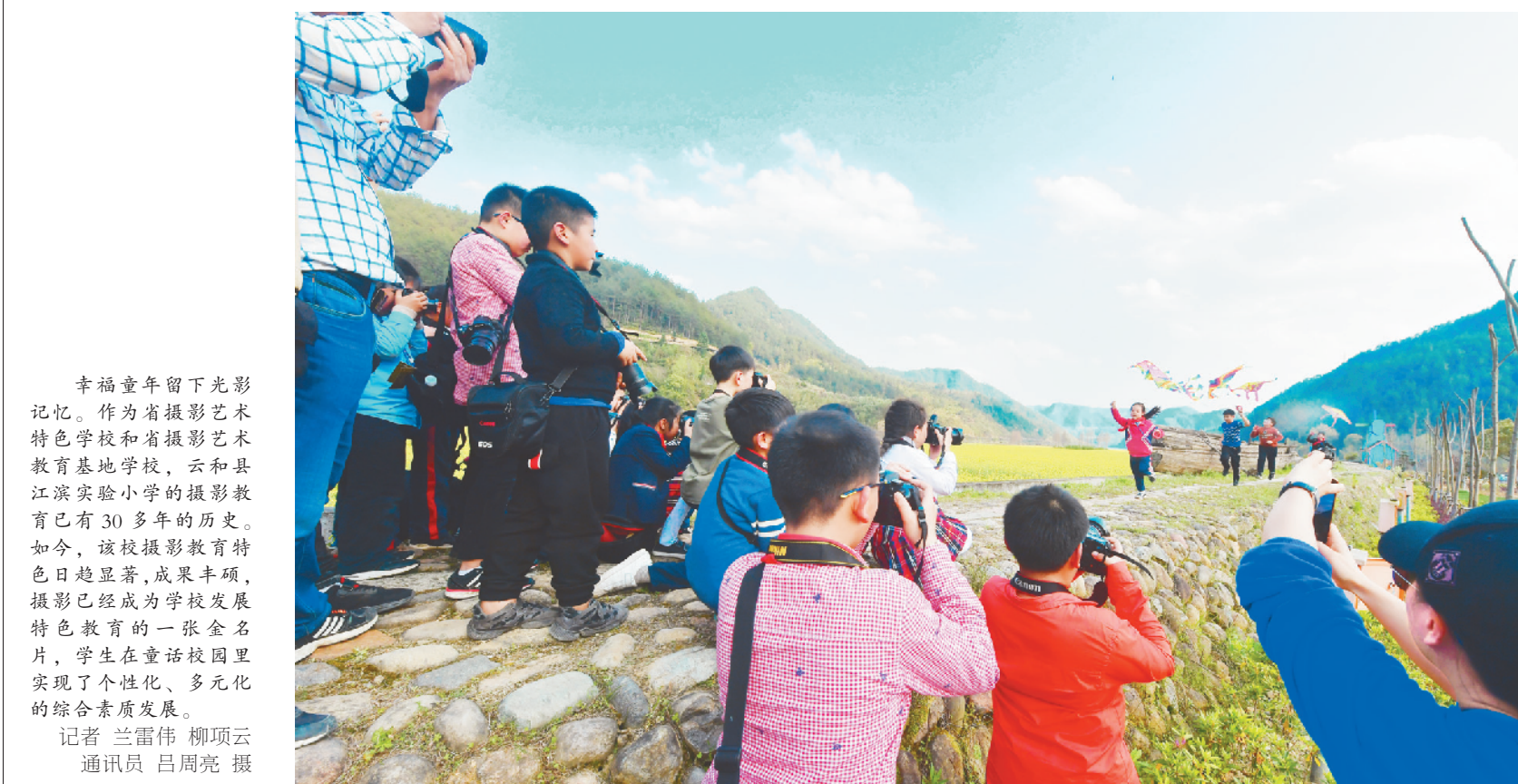
幸福童年留下光影记忆。作为省摄影艺术特色学校和省摄影教育基地学校,云和县江滨实验小学的摄影教育已有30多年的历史。如今,该校摄影教育特色日趋显著,成果丰硕,摄影已经成为学校发展特色教育的一张金名片,学生在童话校园里实现了个性化、多元化的综合素质发展。

近日,庆元县交通窗口组织相关企业召开“最多跑一次”企业面对面交流会。听取企业对交通窗口“最多跑一次”工作的意见和建议,对企业在办理业务过程中存在的问题进行政策解读和业务指导。对非许可审批事项实行备案制,企业驾驶员从业资格诚信考核集中办理等事项,开放免跑窗口。 交通窗口办事“程序再简化、效率再提升”,进一步提高了企业对“最多跑一次”改革的满意度和获得感。 李云