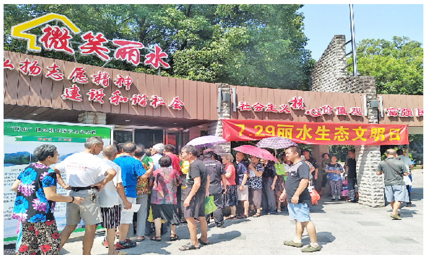
生态文明日宣传活动