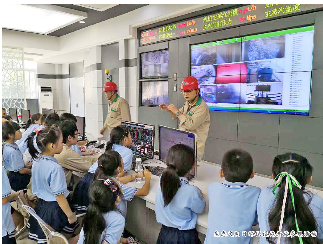
生态文明日环保知识讲座参与互动

严守生态保护红线。落实生态保护红线管控，全面启动全市生态保护红线勘界定标工作，保障生态保护红线落地并加强生态保护红线内开发活动的监管，全面查处生态破坏现象，严防生态安全风险。