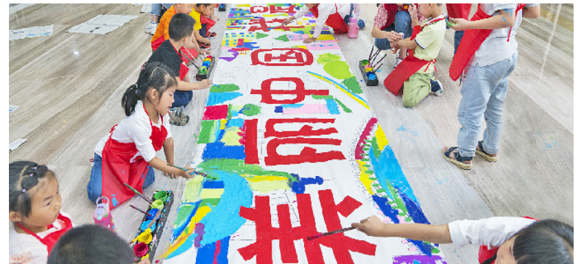
举办“美丽中国我是行动者”六·五世界环境日宣传活动

强化社会公共参与。充分发挥世界环境日、浙江生态日、丽水生态文明日等重要环保纪念日的宣传平台作用，广泛联合社会团体，打造宣传“尖兵”，策划组织全市联动的大型宣传活动，打造丽水环保宣传品牌，让绿色环保理念在全社会蔚然成风。