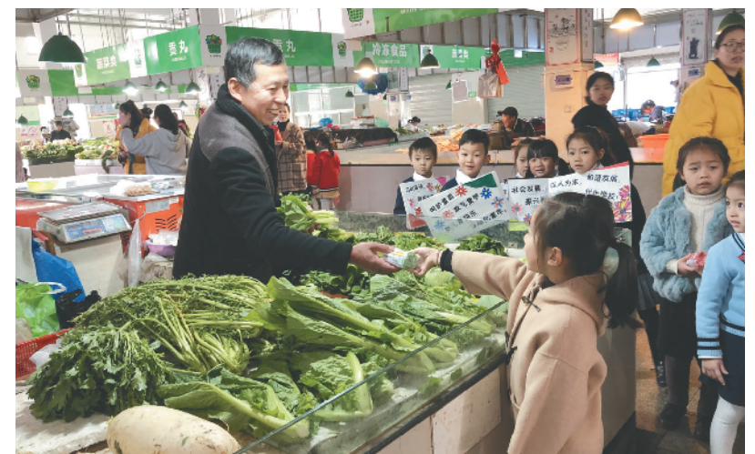
学习雷锋好榜样,3月4日,莲都区机关幼儿园教育集团的小朋友们走进社区,倡议大家养成垃圾分类的好习惯,有效地进行废品回收和资源再利用。图为小朋友向菜场摊贩派发不同颜色的垃圾袋。