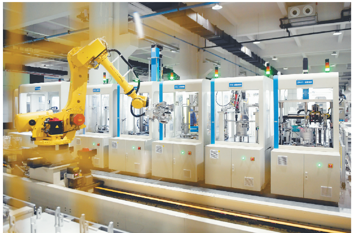
这是浙江卧龙集团的电机自动化生产车间(2月15日摄)。

华达新材是浙江民营企业以国际视野布局多元市场的一个缩影。“东方不亮西方亮，既意味着我们要更加勇于开拓全球市场，也意味着我们要探索更多新兴领域。”浙江盘