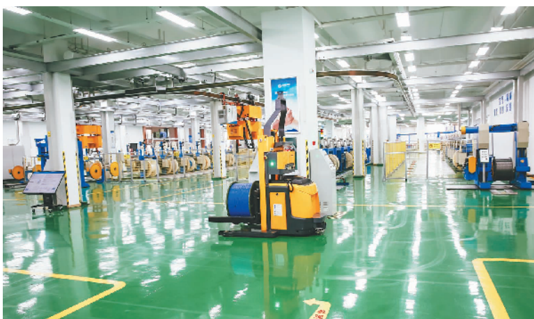
这是富通集团(嘉善)光通信智能制造研发中心(2017年6月1日摄)。