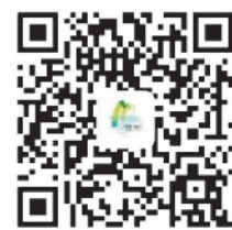
丽水全域旅游惠民卡公众号

主办单位：丽水市文化和广电旅游体育局 承办单位：丽水日报报业传媒集团·丽水日报文化旅游发展有限公司 特别支持：中国银行股份有限公司丽水市分行 中国移动通信集团浙江有限公司丽水分公司 服务热线：0578-2120066 2120077 2123388 丽水全域旅游惠民卡服务中心地址：莲都区中山街北126号(丽水日报报业传媒集团大楼1楼大厅西侧) 各县(市、区)服务点：中行丽水分行各营业网点