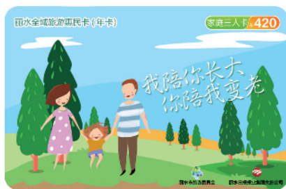
家庭三人卡 420元/卡/年