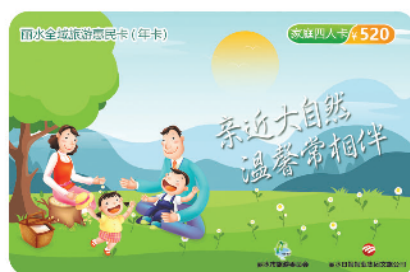
家庭四人卡 520元/卡/年