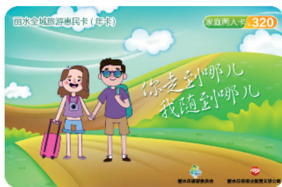
家庭两人卡 320元/卡/年