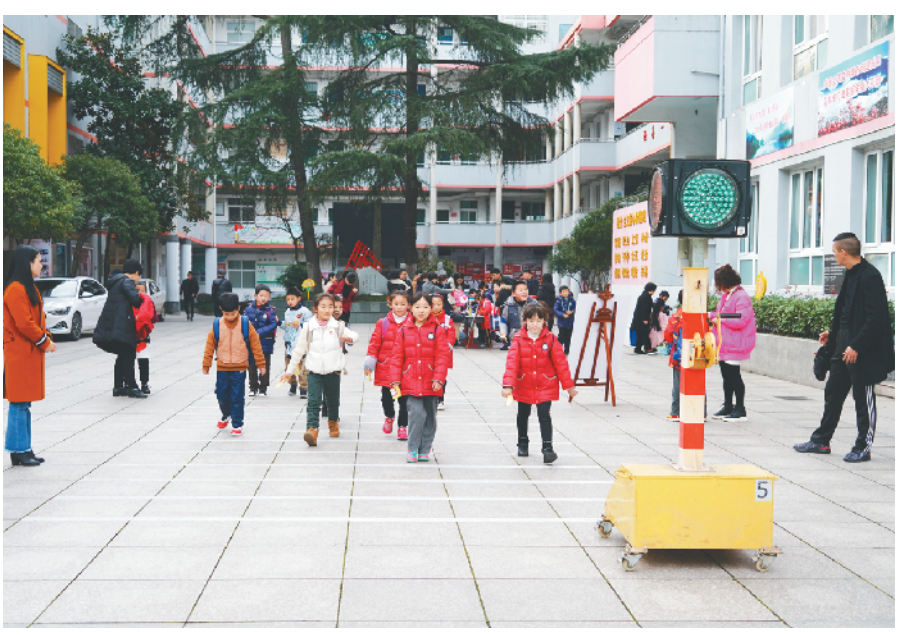
近日,丽水市实验学校二年级举行了一场趣味十足的期末测评——游学考试。除了常规的游学考试项目,今年,学校还新增了两个特别的环节,分别是劳动篇之“系鞋带”,安全篇之“过马路”。

“这次点亮‘微心愿’活动很有意义,城乡小朋友结下了深厚的友谊,城里的孩子学会关心帮助他人,农村的孩子增长视野,实现了心愿。”参加活动的学生家长说,希望通过这样的爱心活动,传递更多的社会正能量,帮助更多贫困学子实现心中的愿望。