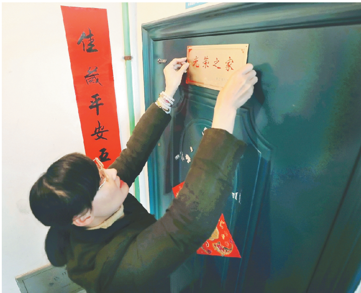
日前,在遂昌县妙高街道青云小区,妙高街道城中社区工作人员上门为退伍军人家庭悬挂光荣牌。光荣牌承载着全社会对烈属、军属和退役军人等对象的尊重,是营造军民团结、拥军优属社会氛围的实际举措,让军人军属有更好的尊崇感和荣誉感。

据了解,为加强人才队伍建设,庆元2018年举办全县基层医务人员培训6次,各类业务讲座100余次;派出医务人员赴杭州、长兴、海曙、丽水进修24人,赴丽水“柔性学习”19人;招聘医学紧缺型人才55人,其中引进人才13人。