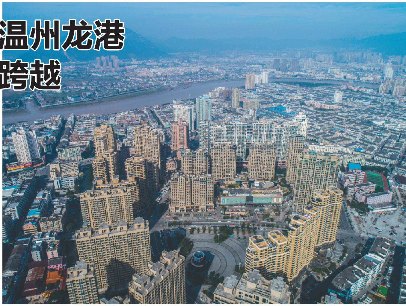
空中俯瞰龙港镇(12月3日无人机拍摄)。