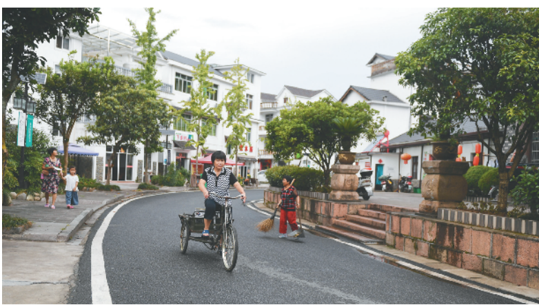
下姜村村民在村庄里骑行(2017年8月9日摄)。