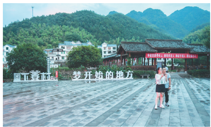
游客在下姜村的小广场游览(2017年8月9日摄)。