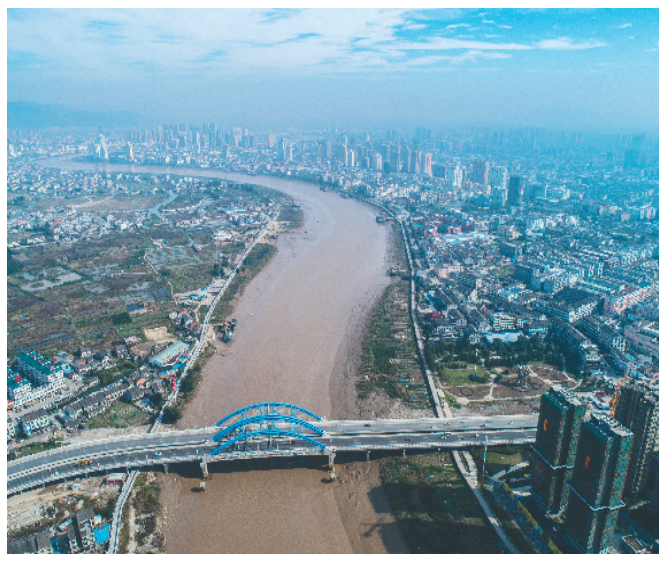
空中俯瞰龙港大桥(12月3日无人机拍摄)。