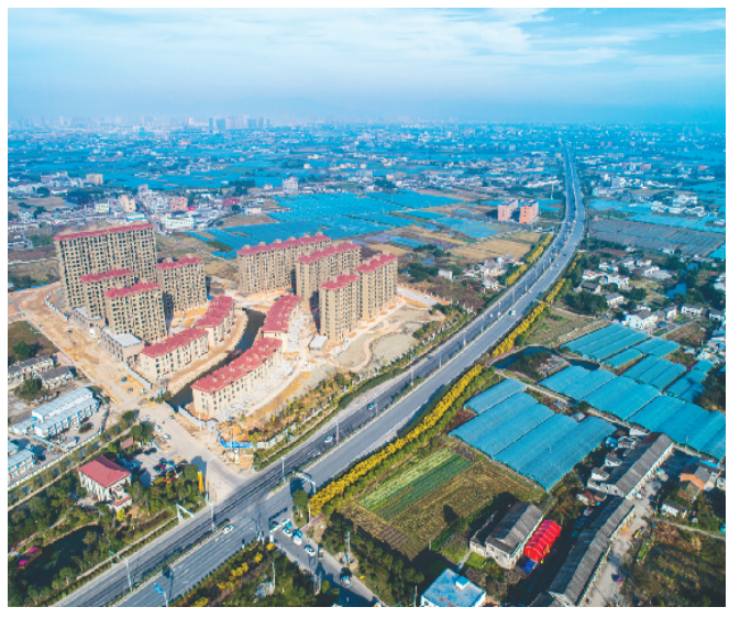
空中俯瞰龙港镇中对口村(12月3日无人机拍摄)。