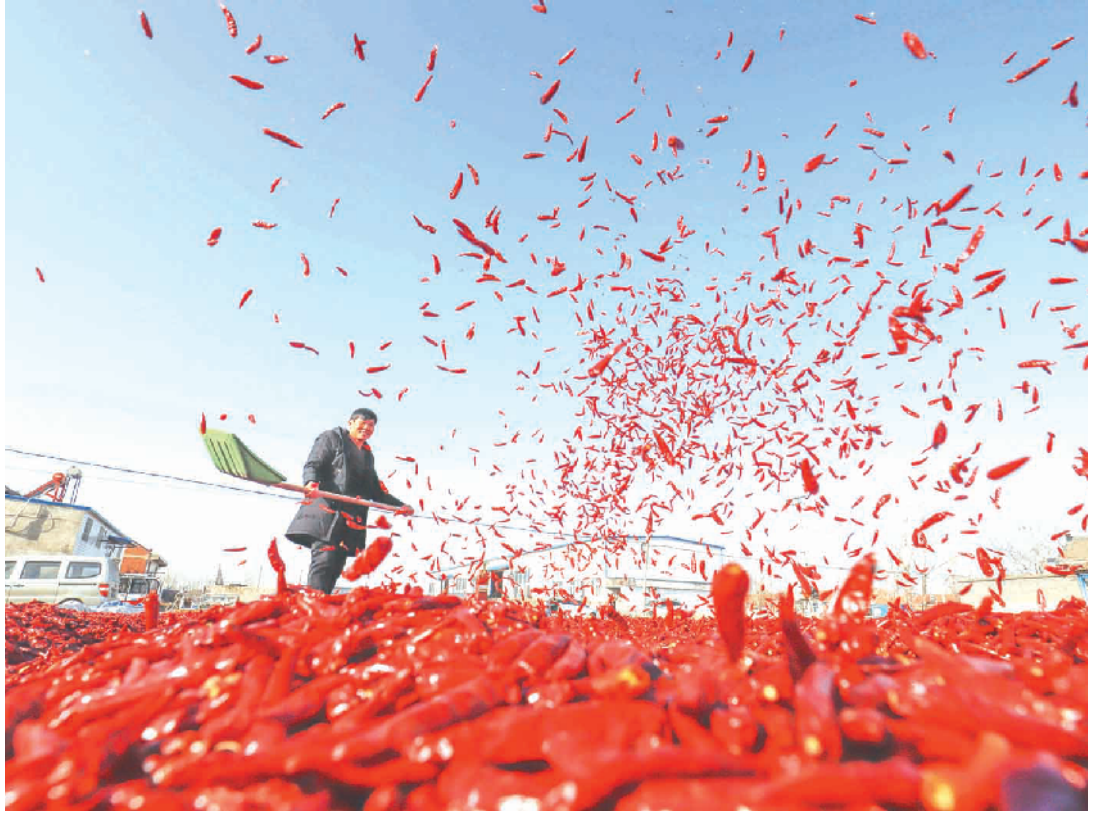
12月4日,河北省唐山市玉田县亮甲店镇黄林村农民在院晾晒辣椒。当日,河北省唐山市玉田县亮甲店镇黄林村农民们利用晴好天气,采摘、晾晒、包装丰收的辣椒,场院里一片繁忙。

据新华社北京12月4日电(记者于佳欣)记者4日从商务部获悉,1-10月,我国服务进出口总额超过4.3万亿元,规模再创新高,增速达到11.1%,全年有望总体保持10%左右的增长。根据商务部当日发布的数据,1-10月,我国服务进出口总额43022.4亿元,其中,出口14211.8亿元,增长14.3%;进口28810.6亿元,增长9.6%;逆差14598.9亿元。从进出口总额看,服务贸易规模与增速均持续向好。商务部服务贸易司副司长李元说,陆续出台的服务贸易创新发展政策有效增强了经济活力,提高了发展质量,增强了服务贸易发展的内生动力。新兴服务快速增长有力地推动了服务贸易高质量发展。商务部数据显示,1-10月,新兴服务进出口总额14181.6亿元,增长20.4%,高于整体增速9.3个百分点,高于传统服务进出口增速13.6个百分点。但从规模上看,传统服务进出口仍占主体地位。