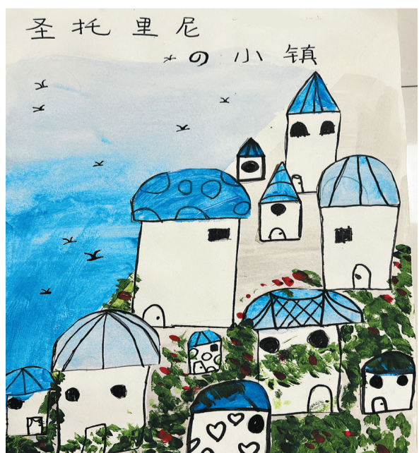
莲都区大洋路小学教育集团城西校区101班 叶奕茵 指导老师 刘 洋