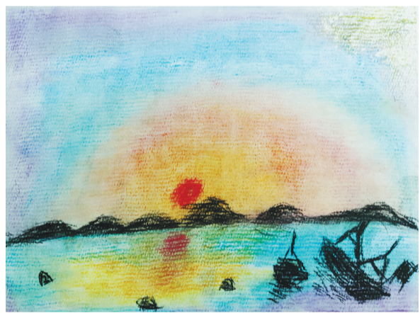
莲都区大洋路小学教育集团城西校区101班 潘柯宇 指导老师 刘 洋