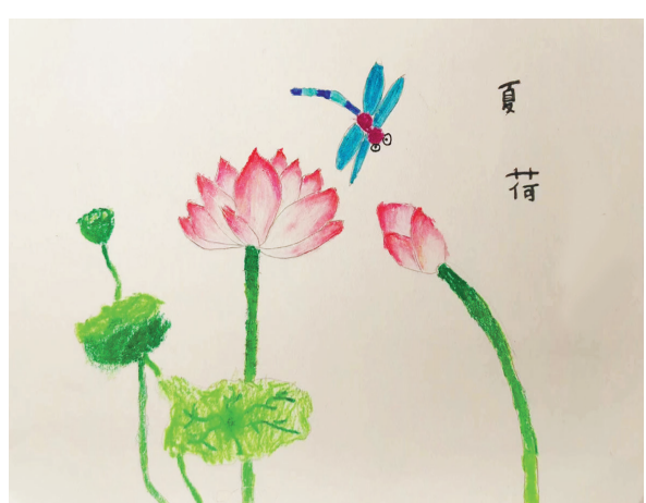
莲都区大洋路小学教育集团城西校区101班 吴瑾翊 指导老师 刘 洋