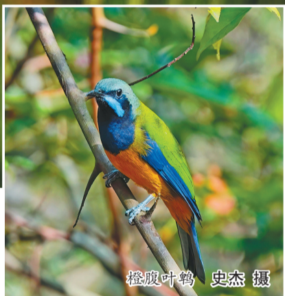
橙腹叶鹎