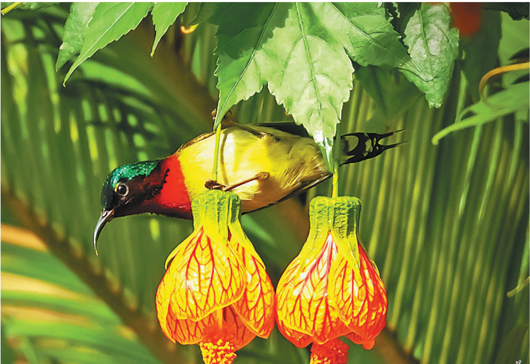
反尾太阳鸟