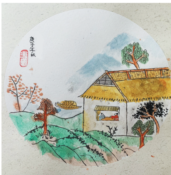
莲都区大洋路小学教育集团大洋路校区503班 周宸伊 指导老师 周丽红