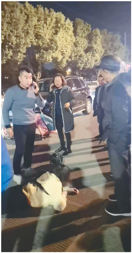
看到车祸,法院干警立即上前了解情况并拨打了 120 急救电话。

昨晚一 SUV 与电动车相撞 出差干警一直守在伤者身边: 我们没有贸然扶她起来 怕造成二次伤害