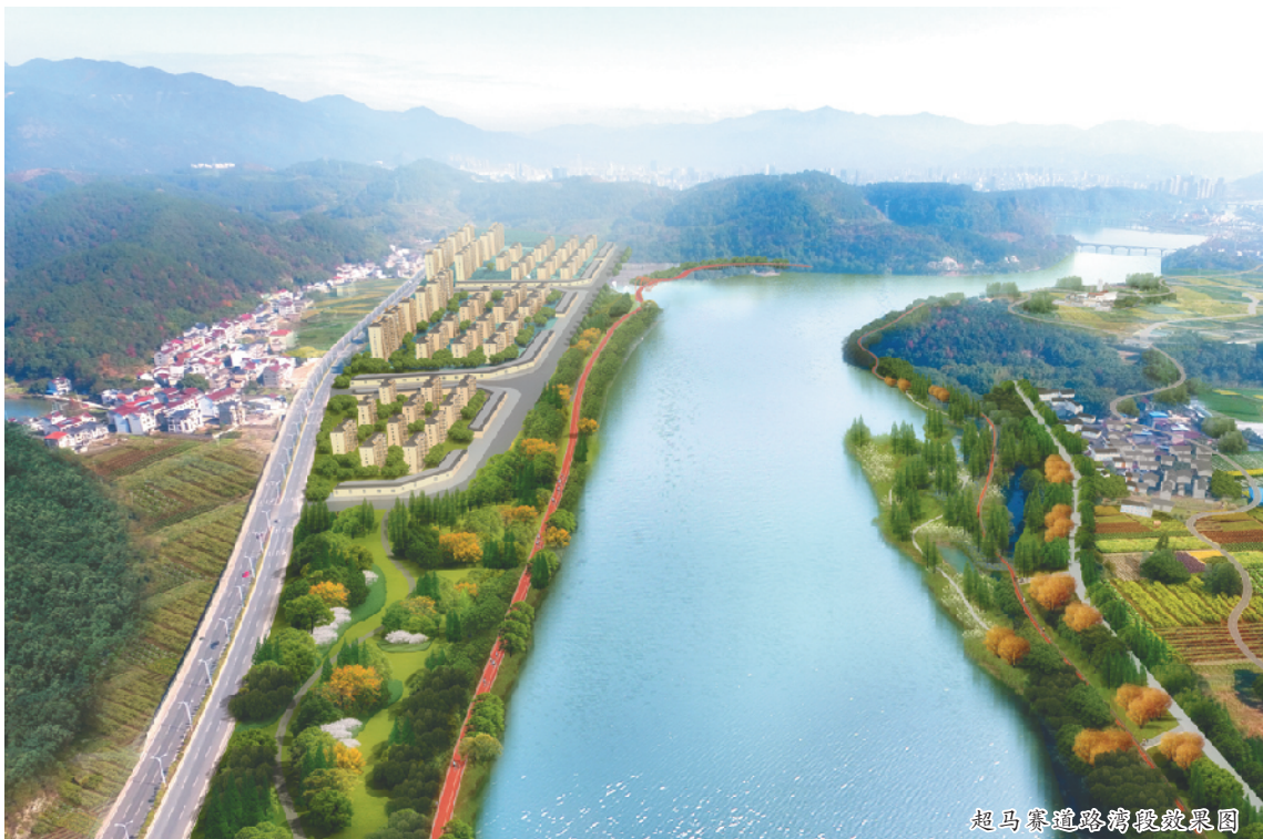
超马赛道跨湾段效果图

瓯江绿道不仅拥有生态功能,更是城市发展多功能复合叠加的重要载体,越来越多地与丽水人的生活发生着实实在在的联系,提升着丽水的动感和活力,日后必将成为市民生活中的“必需品”,也成为全丽水人共建共享的“绿色动脉”。