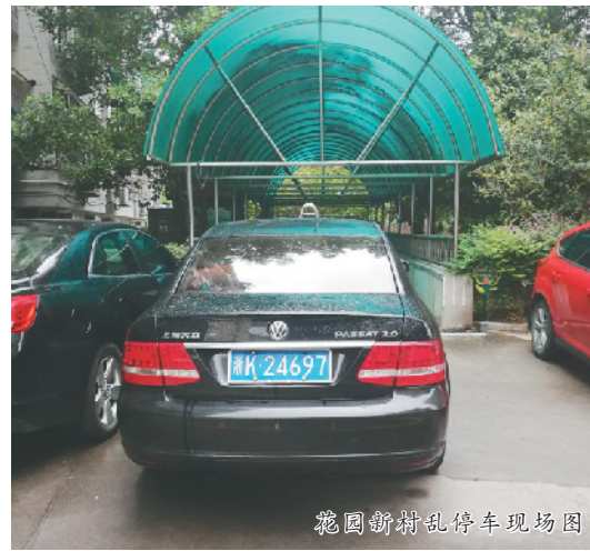
花园新村乱停车现场图

甚至停在了居民柴火间的门口,因此有业主特意在柴火间门口贴上了“禁止停车”的标志。